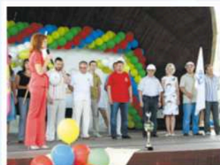
День строителя, 2010 год