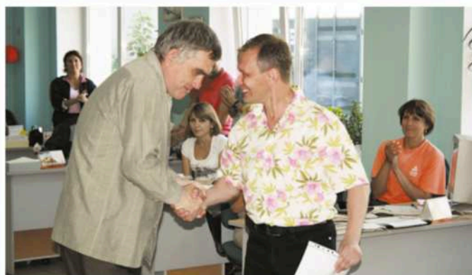
День строителя, 2010 год