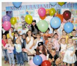
Конкурс детского рисунка, июль 2013