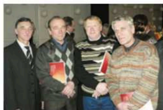
Заводу 55 лет, декабрь 2010