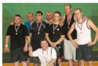
Волейбольная команда «Цех», осень, 2011 год