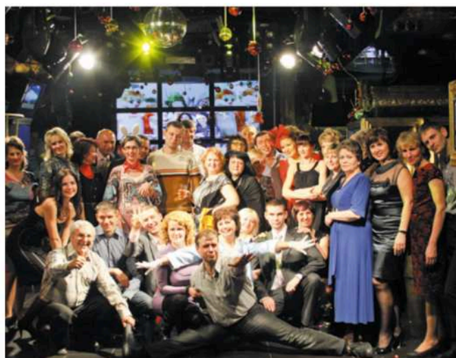
Встречаем Новый год – 2012!