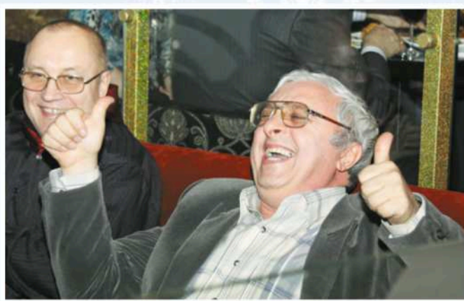
Зажигательный Новый год 2012, в «Малине»