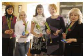
Коллектив бухгалтерии, 8 марта, 2011