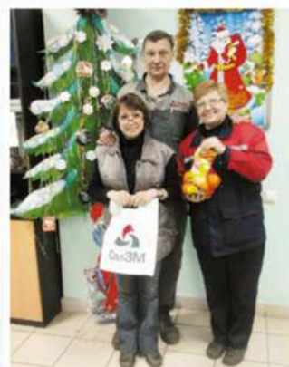
Конкурс новогодних кабинетов, 2014 год