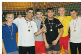
Волейбольный турнир, 2010 год